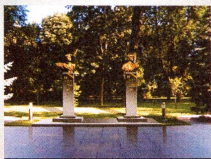
Размещение бюстів Діації Героїв Радянського Союзу Г. Т. Берегового та Амет-Хана Султана