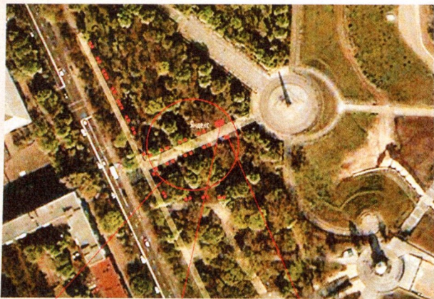
Місце розміщення бюста Героїв Радянського Союзу (перша черга)