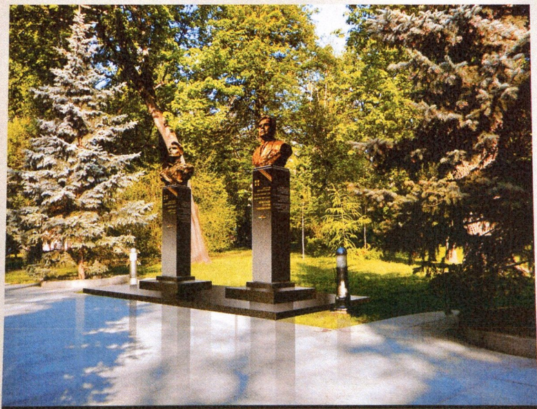
Розміщення бюстів Діації Героїв Радянського Союзу Г. Т. Берегового та Амет-Хана Султана. Перспектива.