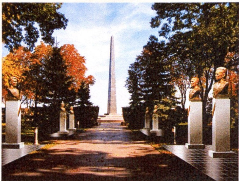
Загальна перспектива Алеї Воїнської Слави